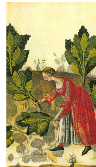
Sonderausstellung 2018 „Klosterküche und Haferbrei“ - Esskultur im Mittelalter -